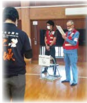
ボランティアへ注意事項を説明