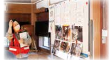
依頼内容の説明とマッチング