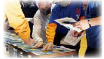
現場に持っていく道具を考えています